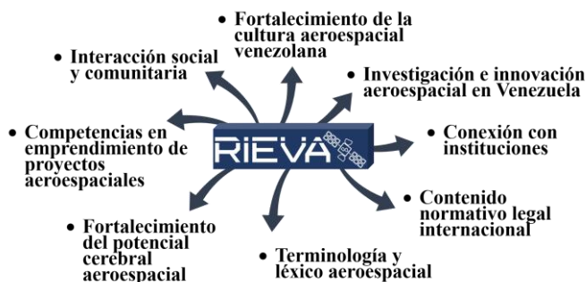
Fig. 2. Entornos conectados a través de la red internacional de entornos aeroespaciales. Elaboración propia.

Los entornos mencionados no son independientes entre sí sino que se presentarán en el campus de RIEVA conectados en un círculo vital colaborativo, por lo que se concibe esta red como un sistema interactivo de información, formación, diálogo actualización, difusión y generación de nuevos conocimientos expertos. Lo anterior obedece a que las redes inteligentes funcionan a semejanza de las redes neuronales, a saber, cuando hay nuevas conexiones hay nuevo conocimiento.