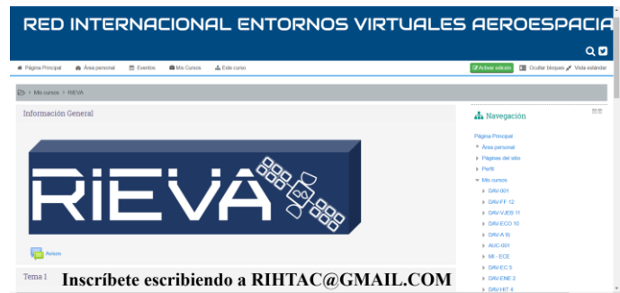
Fig. 3. Foto de prototipo de RIEVA alojada en la comunidad moodle RIHTAC. Elaboración propia.

En el entorno “ Terminología y léxico aeroespacial ” se establece en este modelo, el uso de tecnologías especializadas, wikis, aulas virtuales y bases de datos entre otros esquemas tecnológicos, para la construcción y actualización de un diccionario digital aeroespacial.