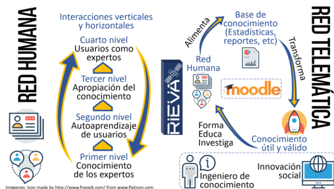
Fig. 1. RIEVA Red Inteligente de Conocimiento integrando la red humana y la red telemática con base a REDIN como aplicación aeroespacial. Elaboración propia.

Por un lado, se entiende como una Infraestructura tecnológica para almacenar el conocimiento a todos aquellos recursos que permitan exportar el conocimiento extraído o generado en la red humana, formateándolos hasta hacerlos compatibles con motores de búsqueda y repositorios digitales.