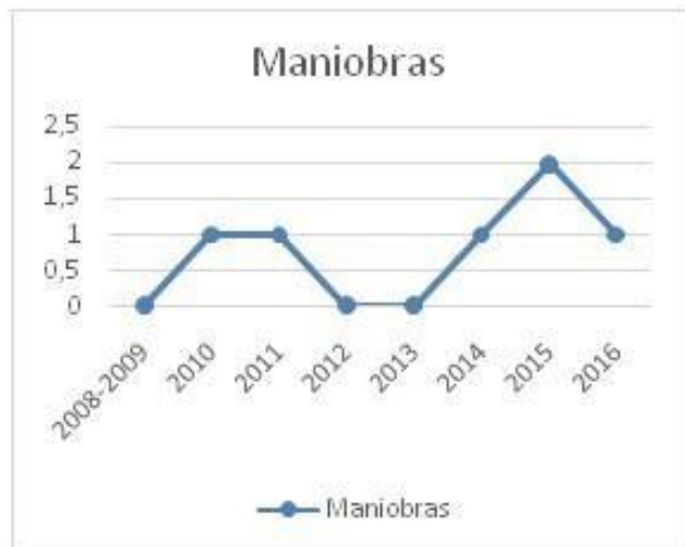
Fig. 2. Cantidad de maniobras de Excentricidad realizadas del Venesat-1.

Ahora bien, tomando el caso específico del Venesat-1, se puede observar en la figura 2 los años en que se realizaron maniobras de excentricidad desde su puesta en órbita. Comparando esta gráfica, con la actividad solar mostrada en la Figura 1, se puede notar que en el periodo 2008 - 2010 se ejecutó solo una maniobra de este tipo, mientras que durante el periodo 2014 - 2016 se ejecutaron más operaciones, coincidiendo con uno de los picos de máxima actividad del 2014.